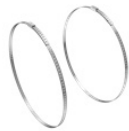
709098001600 FloodOly-P Mounting-Kit-Out-Pole