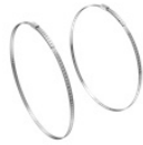
709098001600 FloodOly-P Mounting-Kit-Out-Pole