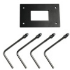
703098000300 LEDBollard-Luke-E Concrete-Mounting-Kit