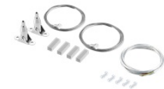
599006009000 LEDLima Suspension-Kit