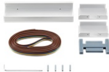
599006008900 LEDLima Connection-Kit