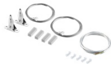
599006009000 LEDLima Suspension-Kit