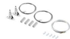
599006009000 LEDLima Suspension-Kit