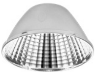
550098000500 LEDSpot3C-C-P R100- Reflector-24D