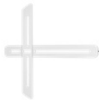
520098001800 LED Apollo HC350 bracket