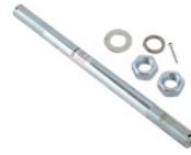
545098003200 LEDHighbay-Pole and Adapter