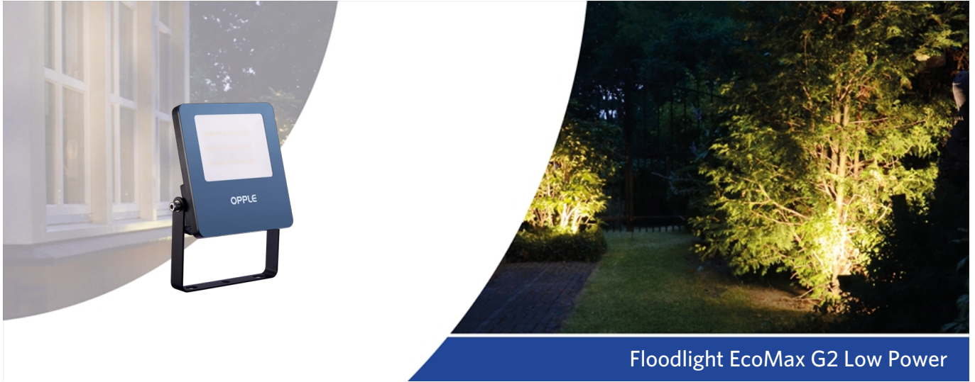
Floodlight EcoMax G2 Low Power