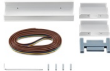
599006008900 LEDLima Connection-Kit