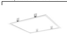
542098009600 LEDPanelRc Sq600-Frame-WH