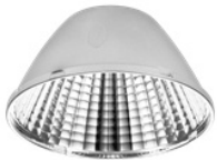
550098000500 LEDspot3C-C-P R100- Reflector-24D