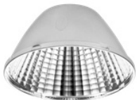
550098001000 LEDSpot3C-C-P R65-Reflector-24D