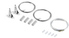
599006009000 LEDLima Suspension-Kit