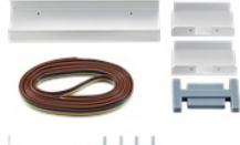
599006008900 LEDLima Connection-Kit