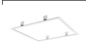
542098009600 LEDPanelRc Sq600-Frame-WH