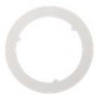
140060647 LEDDownlightRc-P-SI-E-Adapter- 200-225