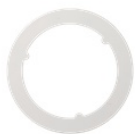
140060647 LEDDownlightRc-P-SI-E-Adapter- 200-225