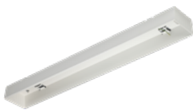
140044057 LEDPanelRc-G Re166-Surface Module-CT